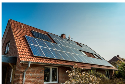
Des projets de travaux ?